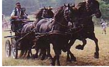
L'attelage à quatre mené par xavier PAQUIN, dans le redoutable parcours de maniabilité tracé sur la prairie de BOUAN

Les amateurs et débutants seront séduits par la sûreté du Mérens en promenade, sous la selle ou en attelage.