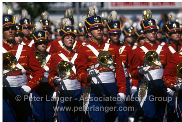
Fanfare du Stampede de Calgary

Un défilé inaugure chaque édition du Stampede. Les fanfares, les chars allégoriques 2 et surtout des milliers de chevaux et des centaines de cow-boys et d'Amérindiens se succèdent lors de cette grande parade.