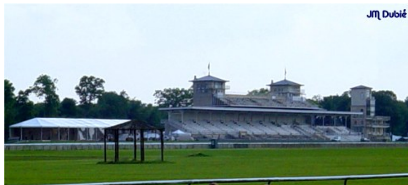
Vue de l'hippodrome

Plus récente, l'activité équestre la plus représentative du lieu est incontestablement celle des courses. Le centre d'entraînement de Chantilly est le plus grand du monde avec 120 km d'allées, 120 ha de gazon et 12 km de parcours de courses d'obstacles. Ses chevaux de pure race sont très recherchés (2600 purs-sangs montés par 800 cavaliers sous la houlette de 99 entraîneurs).