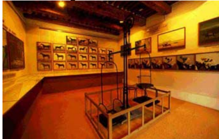
← Salle des chevaux de courses

Son objectif est simple : mettre à la portée de tous, l'équitation académique à travers des collections de harnachements, de selles, de tableaux équestres... soit 31 salles d'exposition, et une présentation de l'animal vivant. Yves BIENAIME a mis en place l'animation, des représentations pédagogiques (au cours desquels chaque exercice de dressage est commenté), des spectacles thématiques. La qualité de chaque représentation, en moyenne 120 chaque année, est d'un tel niveau qu'elles séduisent aussi le cavalier confirmé.