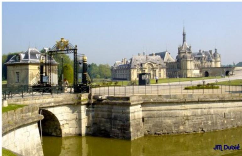
Château de Chantilly

L'hippodrome, qui est un des plus beaux de France, se flatte d'accueillir chaque année de nombreuses courses hippiques dont les plus prestigieuses de notre pays. Le Musée du Cheval de Chantilly accueille également chaque année des milliers de visiteurs.