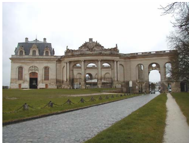
Musée du Cheval