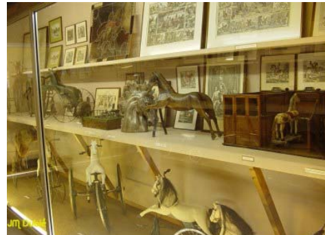
Salle du Jouet →