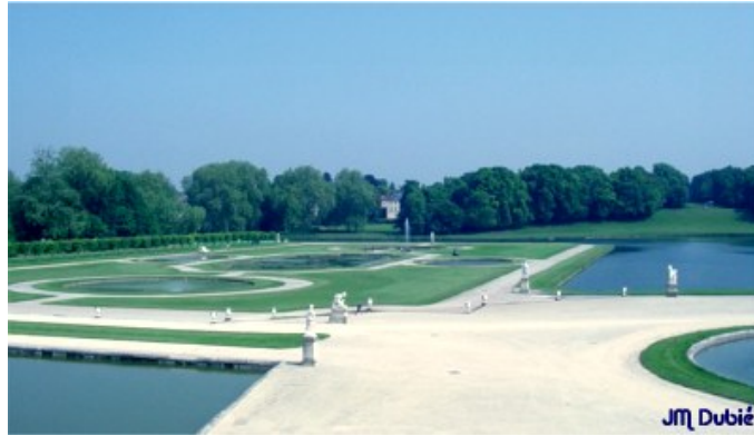
Le Jardin "Le Notre" à la Française et ses jeux d'eau qui ont inspiré le Roi soleil pour la construction du Château de Versailles.

Grâce à cette architecture, Chantilly surpasse Versailles dès le XVIII ème Siècle dans la pratique de la vénerie. De 1815 à 1830, Louis Henri II, dernier Duc de Bourbon, y chasse tous les jours. Plus tard, de nombreux équipages seront créés sur ce site d'exception.