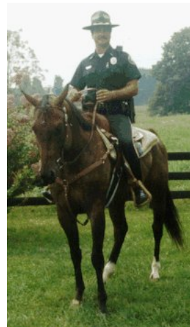
Police du Texas