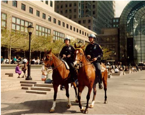
Police de New-York