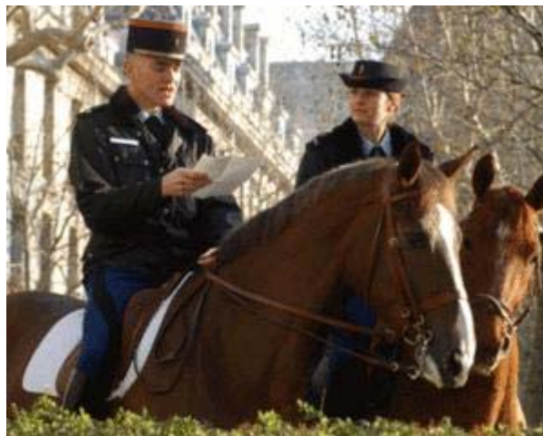
Cavaliers de la Garde Républicaine

Pour être du côté des enseignants, il existe deux voies qui dépendent du grade. Les officiers sont recrutés pour un perfectionnement équestre en deuxième année de Saint-Cyr plus deux ans de service dans un régiment. La formation à Fontainebleau dure dix mois. Ensuite, ils pourront être affectés à l'ENE. Pour les sous-officiers, il n'y a que quelques places disponibles chaque année. Avant d'accéder au stage de formation, ils devront être titulaires du Galop 7 et du tronc commun du BEES.