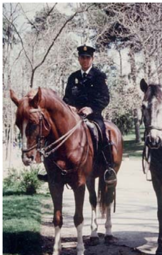
Police montée d'Espagne