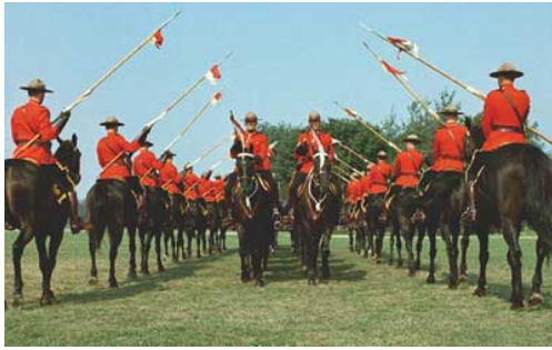
Patrouilles montées au Canada