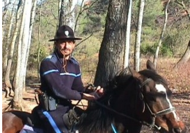
Surveillance des bois

Les brigades équestres sont également mises en place dans un but de protection de la nature notamment pour la prévention des incendies. En effet, la Police Municipale a elle aussi une mission de lutte contre les incendies. Cette mission est exercée par la Brigade équestre. Composée de 3 cavaliers, 1 brigadier chef principal et 2 brigadiers chefs, elle travaille en binôme.