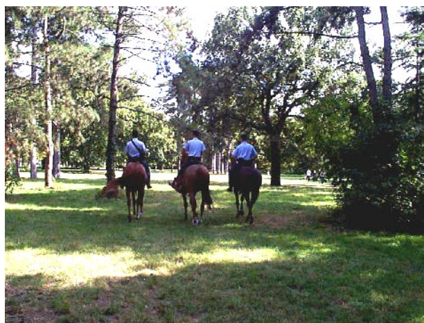
Police Montée dans le Bois de Boulogne

L'usage du cheval en milieu urbain se cantonne encore généralement à la surveillance des espaces boisés en périphérie des villes, ou des parcs urbains. Il est vrai que ce moyen a prouvé son efficacité pour chasser hors des fourrés la prostitution, la vente de drogues et la faune délinquante qui inventorie le produit des derniers vols à l'arrachée.