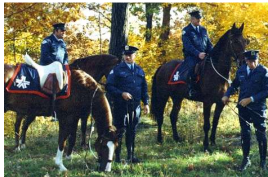
Police montée de Montréal