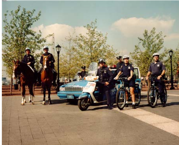
Quelques moyens de locomotion de la police de New-York (identiques en France)

La Police Montée existe maintenant depuis plus d'un siècle. Aujourd'hui, époque où la voiture, la moto, voire l'hélicoptère ou l'avion ont une importante place dans la police, le cheval a également sa place. En effet, le cheval a su garder dans notre société, une place primordiale grâce à la convivialité qu'il dégage.