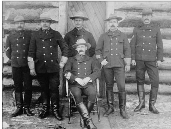
Personnel de la Police Montée du Nord-Ouest (Canada)

La Police à cheval devait également établir des relations amicales avec les lères nations, réprimer la contrebande de whisky, faire respecter la prohibition mais aussi contribuer au processus de la colonisation en assurant le bien-être des migrants, en combattant les feux de prairies, les maladies et le dénuement.