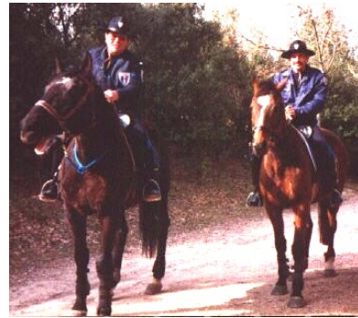
Police montée de France