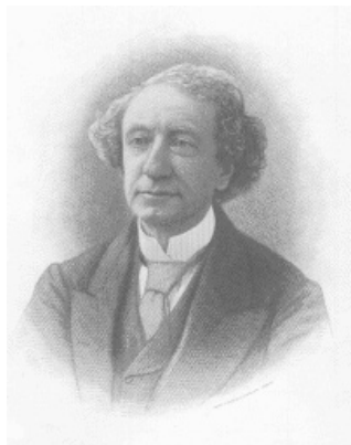
Sir John A. Macdonald

Pour l'organisation de la Police Montée, de nombreux officiers furent nommés et un important recrutement pour la Police à cheval du Nord-Ouest eu lieu.