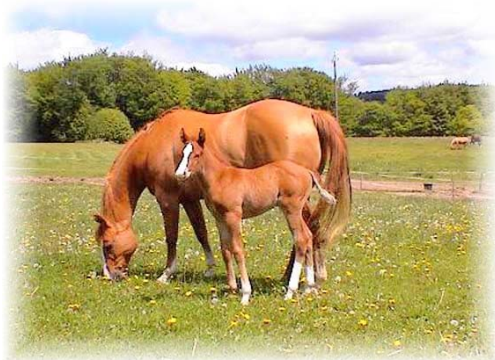
Quarter - Horses

Un cheval de Horse-Ball doit présenter les qualités suivantes :