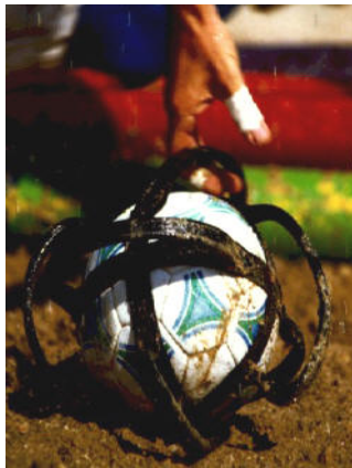
Balle de Horse-Ball

Les matchs sont arbitrés par deux arbitres : un arbitre de chaise (assis en hauteur comme au tennis) et un arbitre de terrain à cheval.